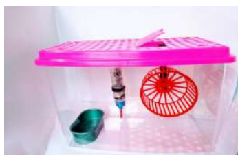
Código: HA Kit Jaula Hamster