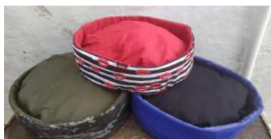
Código: MR1 Moises rosca impermeable diam-50cm