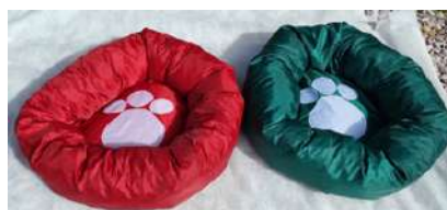
Código: MRO Moises rosca impermeable diam-50cm