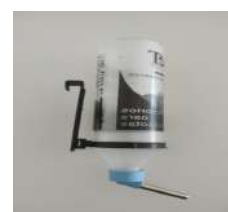
Código: BHC/1 Bebedero Hamster/ Conejo Chico