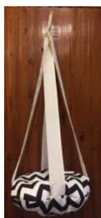
Código: MP1 Moises colgante 1 piso diam-50cm