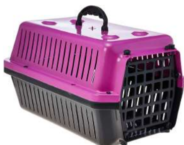
Código: TA2 Transportadora alvorada N2 48x30x27cm