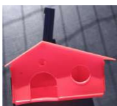
Código: CHA Casita para Hamster