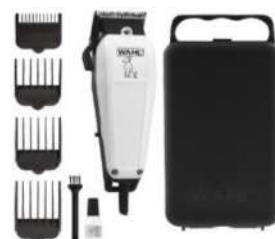
Pet Clipper Kit