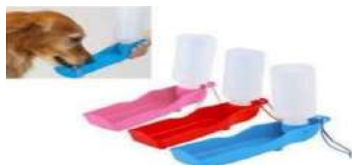
Código: BP500ml Bebedero portable 500ml