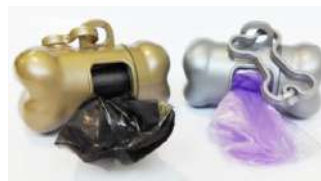
Código: HB Hueso porta bolsa