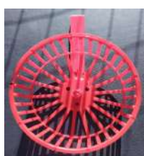
Código: RH Rueda para Hamster