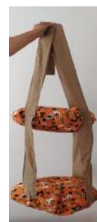
Código: MP2 Moises colgante 1 piso diam-50cm