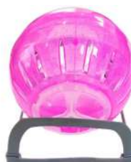
Código: HE Esfera Hamster