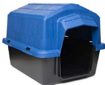
Casa alvorada N2 40x60x42cm